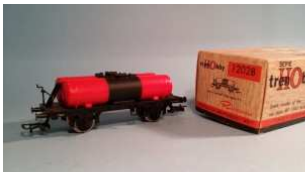
Carro Serie Trenhobby