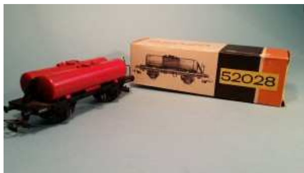
Carro Serie RR